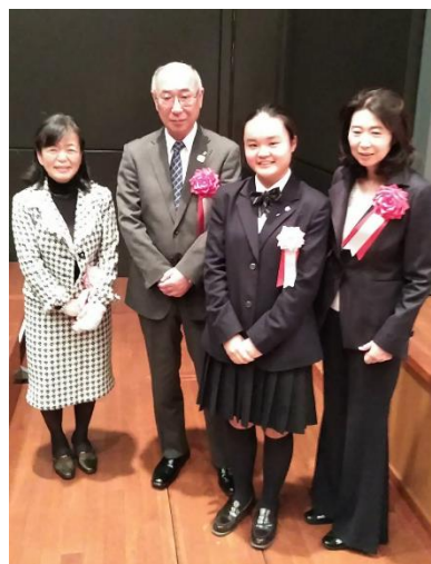
桐谷教育長と河野教育委員との記念撮影。